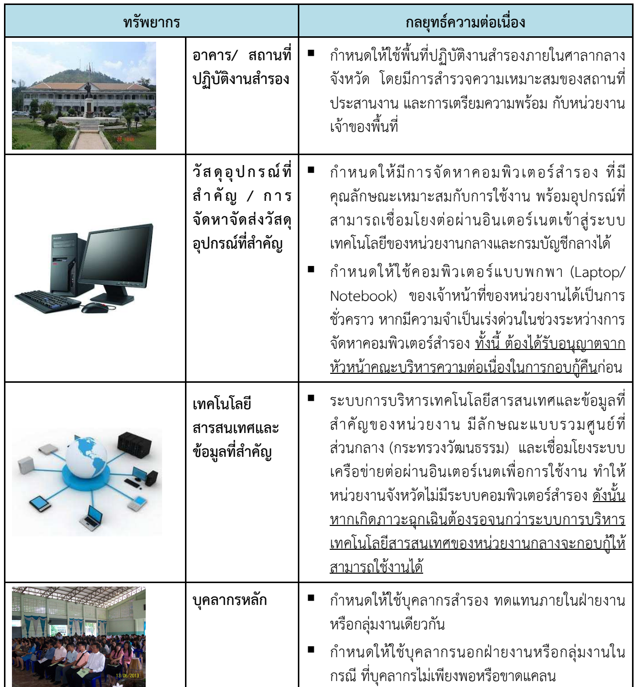
ตารางที่ 2 กลยุทธ์ความต่อเนื่อง (Business Continuity Strategy)

กลยุทธ์ความต่อเนื่อง เป็นแนวทางในการจัดหาและบริหารจัดการทรัพยากรให้มีความพร้อมเมื่อเกิดสภาวะวิกฤต ซึ่งพิจารณาทรัพยากรใน 5 ด้าน ดังตารางที่ 2