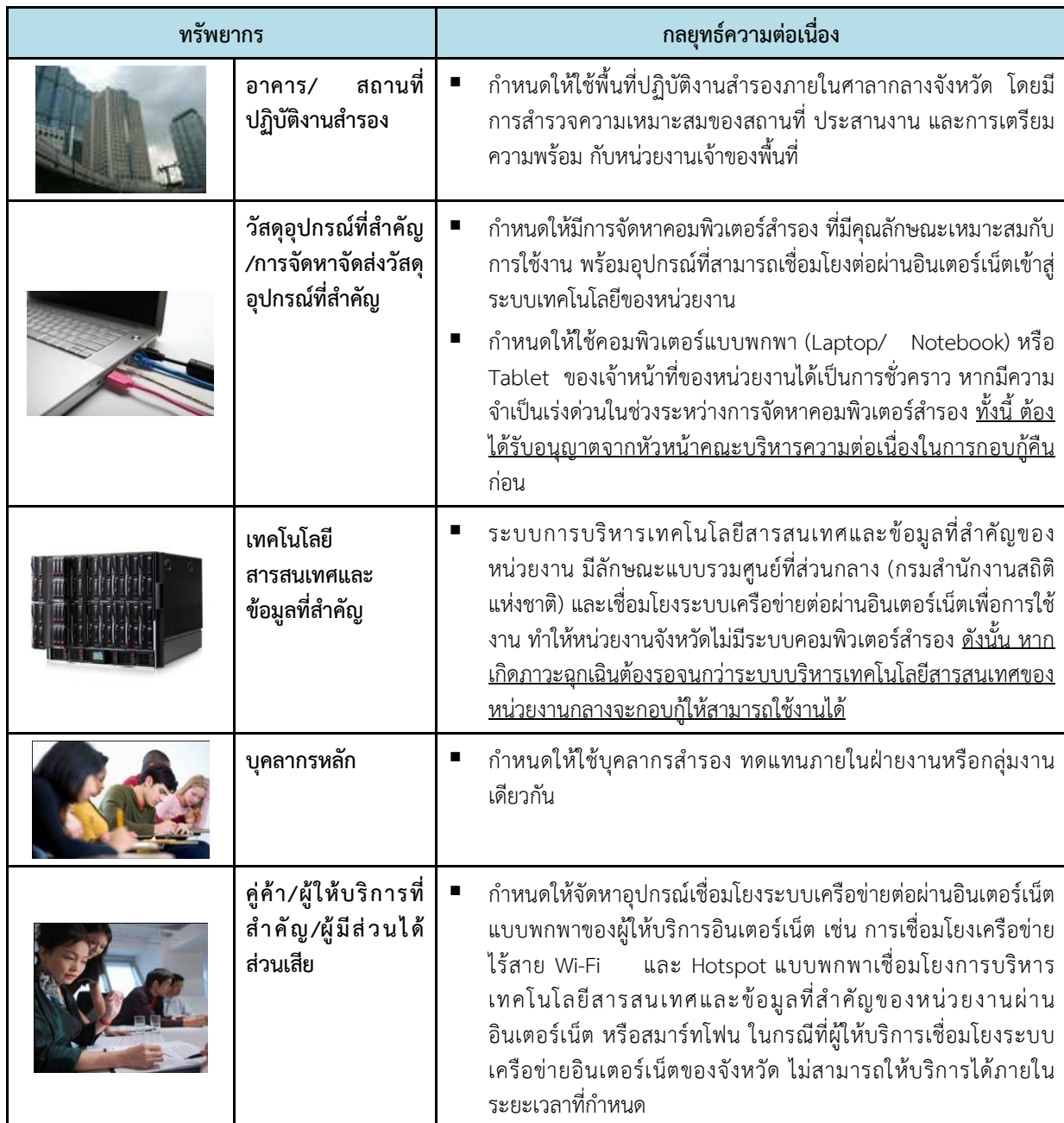
ตารางที่ 2 กลยุทธ์ความต่อเนื่อง (Business Continuity Strategy)

กลยุทธ์ความต่อเนื่อง เป็นแนวทางในการจัดทําและบริหารจัดการทรัพยากรให้มีความพร้อมเมื่อเกิดสภาวะวิกฤต ซึ่งพิจารณาทรัพยากรใน 5 ด้าน ดังตารางที่ 2